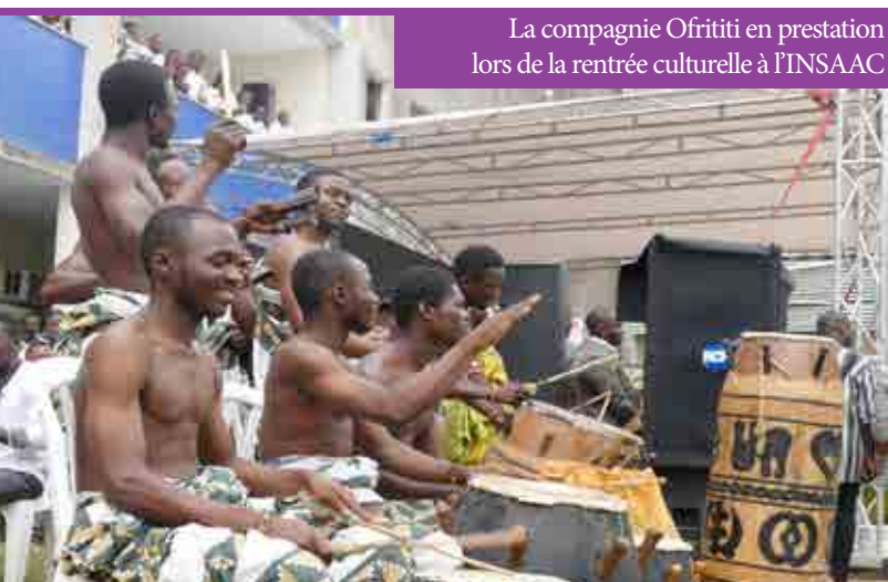
La compagnie Ofritti en prestation lors de la rentrée culturelle à l'INSAAC