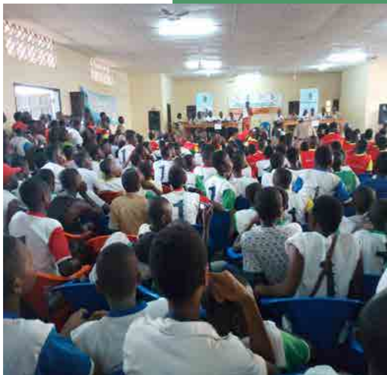
Vue d'ensemble , phase de Bouaflé

Il faut noter que le partenariat entre la CNF et l'OMED existe depuis 2012, car les objectifs du concours de débat contradictoire entrent dans le cadre des missions de la Francophonie, notamment la mission B qui fait la promotion de la Démocratie, de la paix et des Droits de l'Homme.