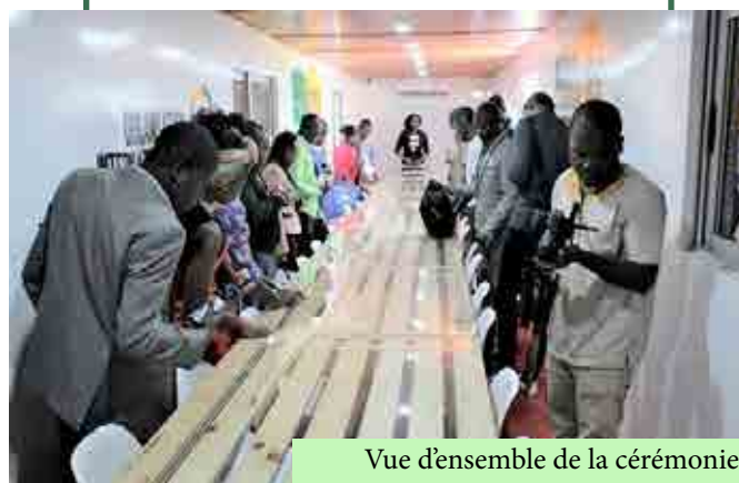
Vue d'ensemble de la cérémonie de remise d'attestation

Pour rappel, l'initiative «Libres Ensemble» a été lancée le 10 mars 2016 par les jeunes francophones et la Secrétaire générale de la Francophonie en réaction au phénomène croissant de radicalisation violente (politique, idéologique, sociale et religieuse) des jeunes et à la multiplication d'actes terroristes survenus dans l'espace francophone. Cette initiative appelle les jeunes à se mobiliser, s'exprimer, participer et s'engager par des actions concrètes au service de la diversité, de la paix, de la liberté, du «Vivre ensemble», afin de prévenir le risque de radicalisation politique, idéologique, sociale et religieuse menant à la violence.