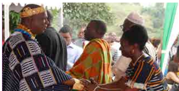
Le Ministre de la Culture et de la Francophonie saluant Mme la Secrétaire Générale Adjointe de la CNF