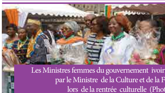
Les Ministres femmes du gouvernement ivoirien honorées par le Ministre de la Culture et de la Francophonie lors de la rentrée culturelle (Photo de famille)